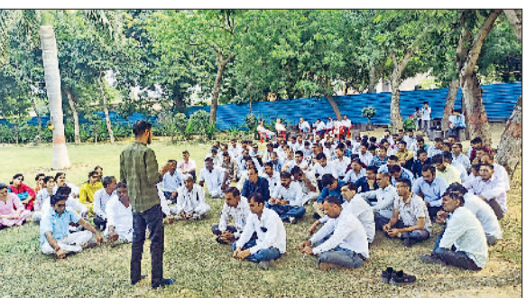
शिक्षा बोर्ड में द्वार सभा को संबोधित करते कर्मचारी नेता।

हरियाणा विद्यालय शिक्षा बोर्ड के कर्मचारी संगठन-1016 संबद्ध सर्व कर्मचारी संघ हरियाणा ने उत्तर पुस्तिका मुद्रण प्रणाली के विरोध में शुक्रवार को लगातार तीसरे दिन भी बोर्ड मुख्यालय पर द्वार सभा का आयोजन किया। इस विरोध प्रदर्शन