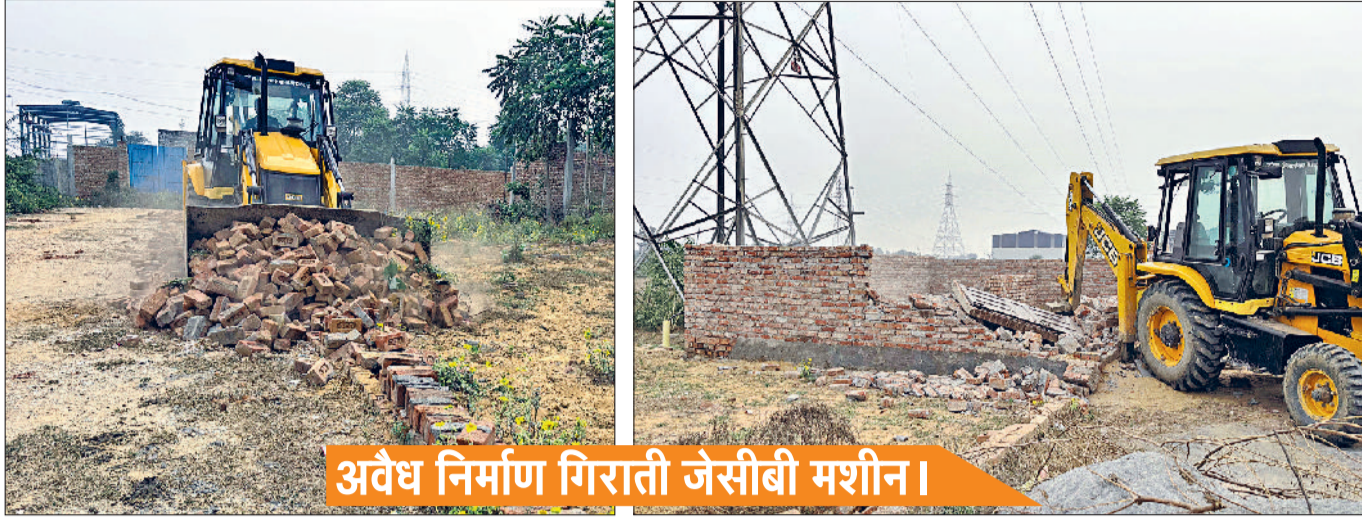
अवैध निर्माण गिराती जेसीबी मशीन।

शुक्रवार को नगर योजनाकार विभाग द्वारा उपायुक्त साहिल गुप्ता के निर्देशानुसार लगातार अवैध निर्माण हटायो अभियान चलाया जा रहा है, जिसके तहत नगर योजनाकार विभाग की टीम ने भिवानी-दादरी रोड पर मौजा देवसर में लगभग डेढ़ एकड़ में फैली एक कॉलोनी पर पीला पंजा चलाकर अवैध निर्माण तोड़ा। डीटीपी की टीम ने प्लॉटिंग करने वालों व प्लॉट खरीदने वालों को चेतावनी दी कि वे नियमों की उल्लंघना न करें।