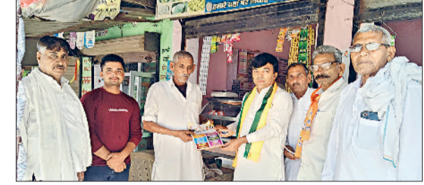
व्यापारियों व आमजन से स्वदेशी वस्तुओं के उपयोग पर चर्चा करते भाजपा नेता।