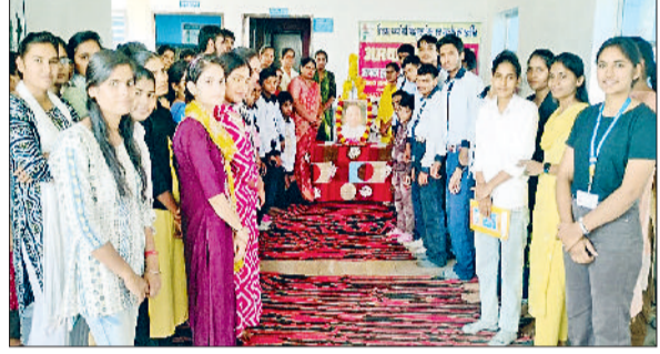
मिवानी। सरदार पटेल को नमन करते शिक्षक व दिव्यांग विद्यार्थी।