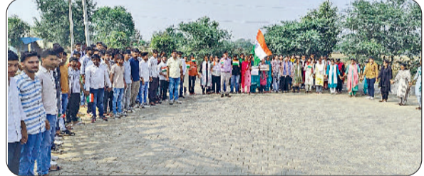
बाढ़ड़ा। रन फॉर यूनिटी में भाग लेते राजकीय महाविद्यालय के स्वयंसेवक।